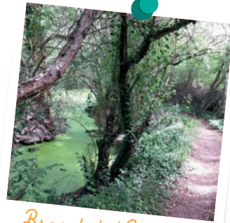
Bras de la Charente

11 - Traverser au passage protégé situé à gauche et emprunter la rue des Pradelles de la Combe. Dans le 3 e virage, suivre en face le cheminement doux bleu jusqu'au plan d'eau. Rejoindre le parking par la gauche.