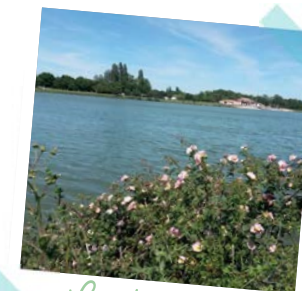
Le plan d'eau

Longer le fleuve pendant 1,5 km. Point de départ de la Coulée Verte, la Petite Prairie est un espace protégé pour la faune et la flore de cette prairie de fauche inondable.