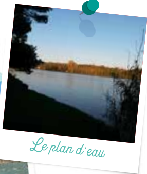
Le plan d'eau