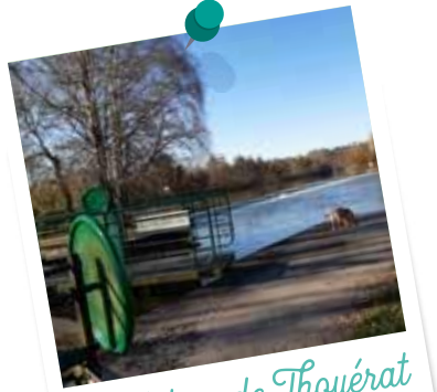
L'écluse de Thouérat

11 - Quitter le chemin pour prendre le petit sentier à gauche qui descend dans le bois. À la sortie du bois, longer le champ vers la droite pour remonter à droite dans le sous-bois.